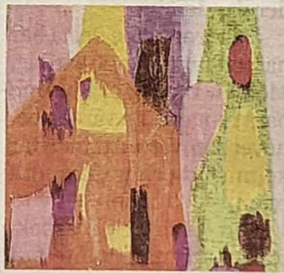
En färgrik målning som skapats av ett barn i Föreningen Färger i Eslöv.

I Tomelilla har Byavångsskolans årskurs fyra samarbetat med en skotsk fotograf, och fått lära sig en speciell fototeknik. Barnen i Trelleborg, där en del